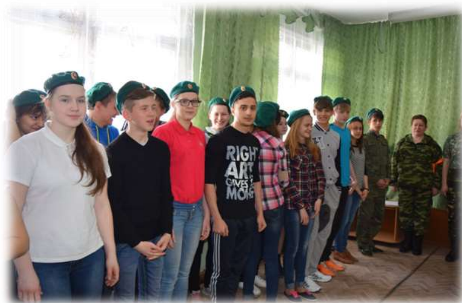
Обучающиеся 8-9 классов участники сбора Ассоциации детских и юношеских объединений и организаций Советского района