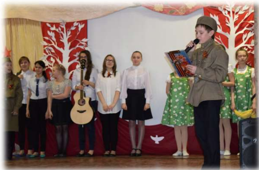
Агитбригада ДК «Сибирь» с подарком в школе №4 г.Советский