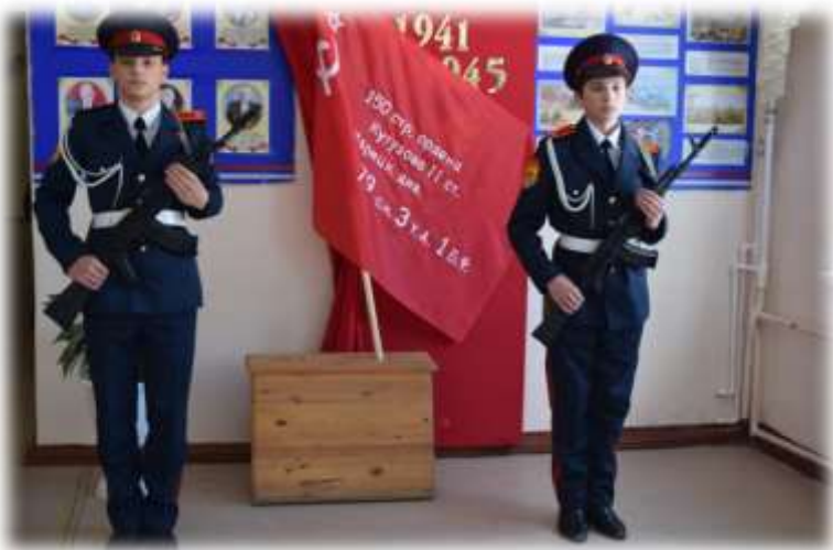
Вахта памяти «Часовой у Знамени Победы»