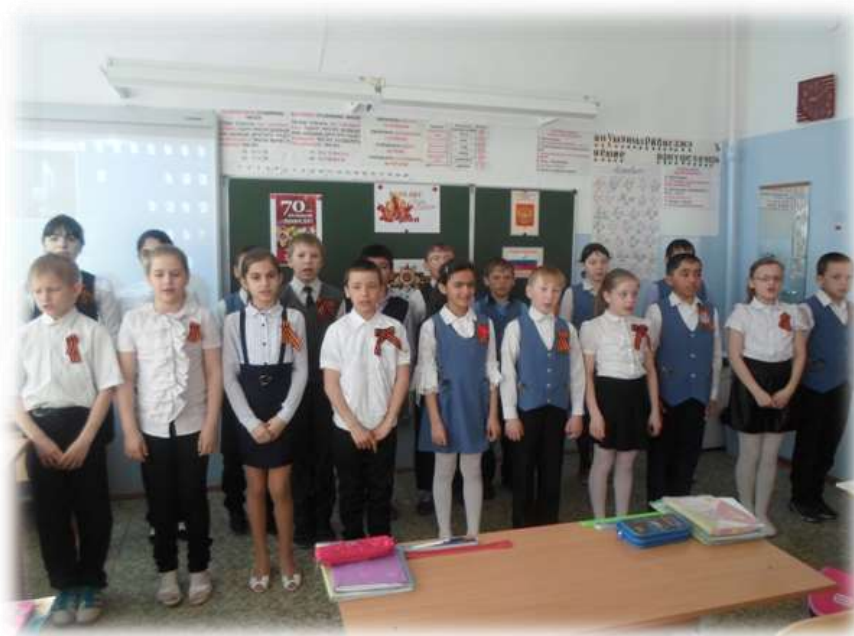
4 «В» класс исполняет песню «День Победы»