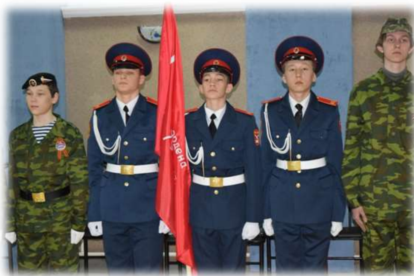
Торжественная линейка «Встреча Знамени Победы»

Взвейся Знамя Победы! Государственный флаг! Слышу голос из бездны: «Здесь победный наш стяг! Мы под знаменем красным шли бесстрашно вперед За любимую Родину, за советский народ!» Пусть же Знамя Победы в нашей школе стоит, С вами, прадеды, деды пусть оно единит! Это важно сегодня для тебя, для меня. Вспоминаем героев мы, скорбя и любя.