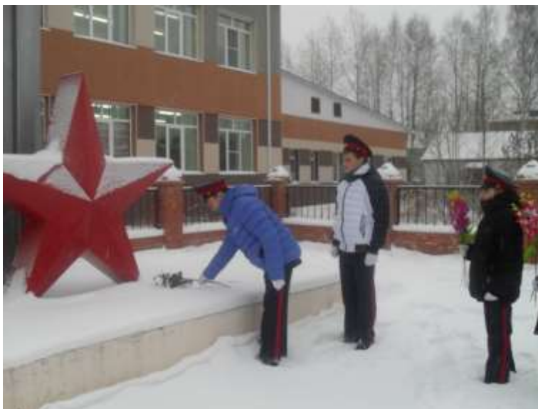
Возложение цветов к обелиску «40 лет Победы»