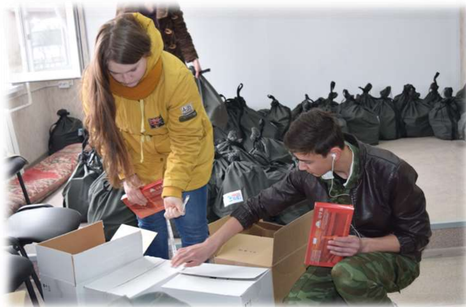
Волонтеры школы формируют подарки ветеранам