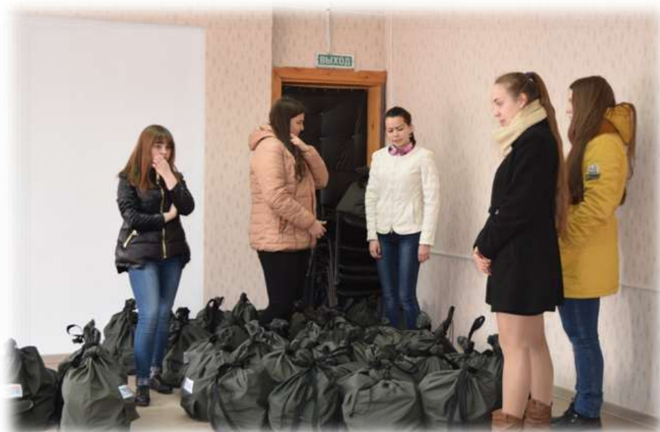
«Подарки готовы. Можно в путь.»