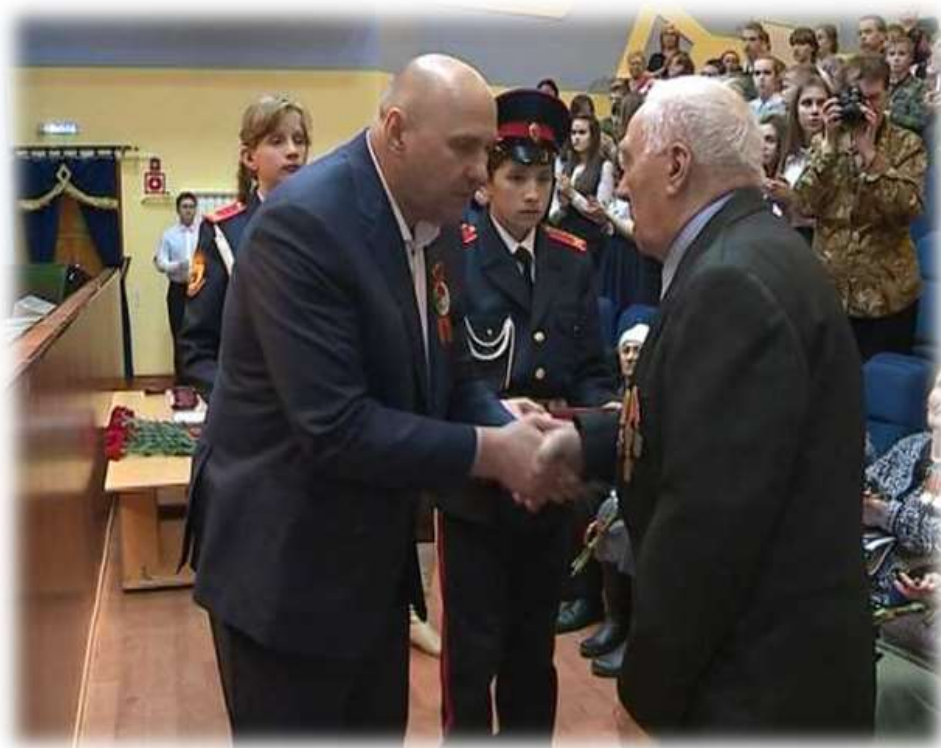
Кадеты МБОУСОШ №4 участники мероприятия