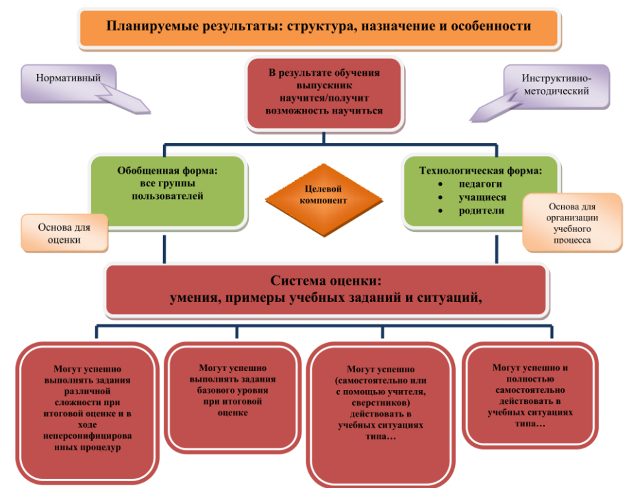
Рис. 1 Система оценки достижений планируемых результатов в условиях реализации

Основными направлениями и целями оценочной деятельности в образовательной организации являются: